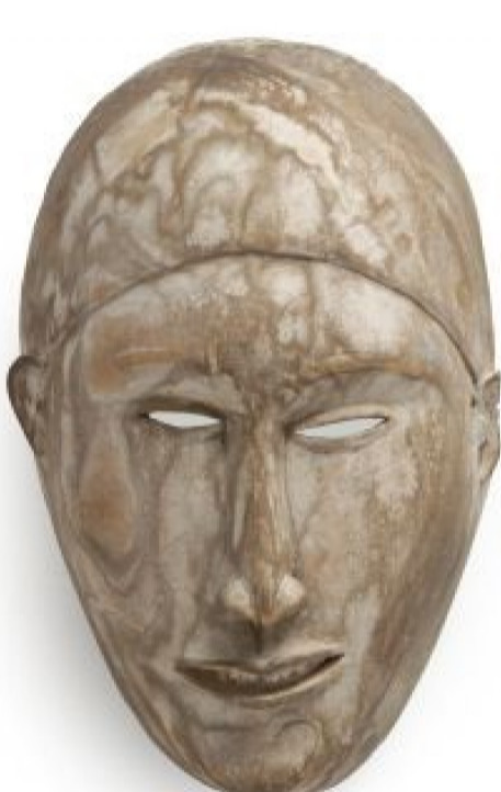
Masque Yombe, 19e siècle, Musée L

Voici le mois des carnivals : on se masque et on se démasque ! Mais derrière le masque, qui sommes-nous vraiment ?