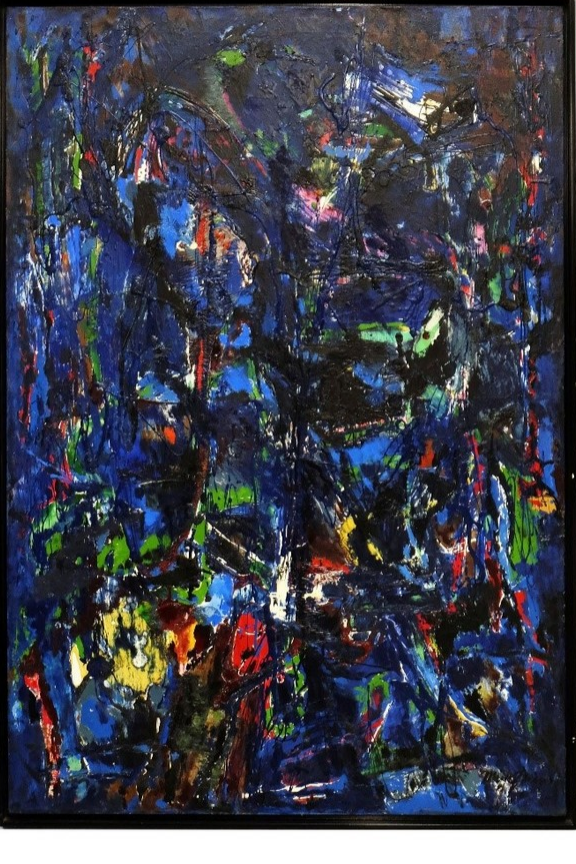
Mig Quinet, Le cœur de l'arbre, 1960

La beauté est un mystère dont nous ne forcerons jamais le secret. Mais n'est-ce pas ce mystère qui fait aussi sa magie ? Car le questionnement suscite la rencontre.